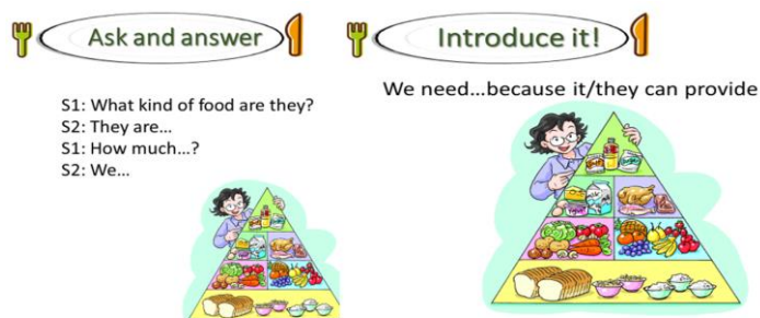
图 2.“描述和阐释”教学活动图例

此活动的目的是让学生运用所学有关食物名称与食物摄入量的语言知识，描述食物金字塔图片传达的信息，同时结合自己生活常识阐释食物对人类健康的影响与作用。该教学片断紧扣饮食健康主题，基于学生所形成的“饮食知识结构”开展描述图片以及阐释饮食健康原理，充分聚焦语言内化过程，促进语言运用的自动化。