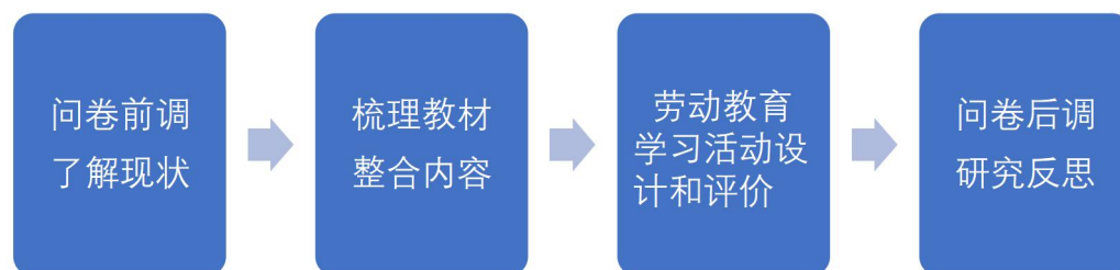
图 1：小学道德与法治学科整合开展劳动教育实施路径

关注目前的劳动教育现状，我们发现劳动教育在现实生活中还存在着某些问题，如家庭软化、社会淡化、劳动教育有效性不足等现象，所以，如何在道德与法治课程中提升劳动教育有效性的研究尤为重要。笔者作为区域学科骨干，开展了小学道德与法治背景下劳动教育的项目研究。理论联系实际，梳理出相关实施路径。如下图所示：