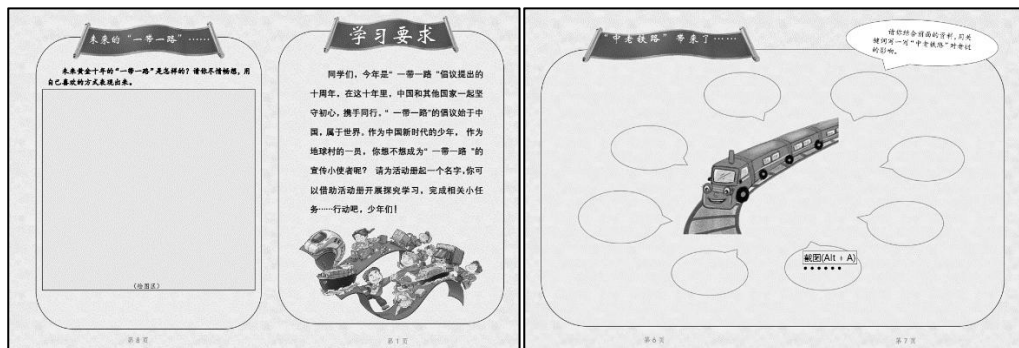
图3 活动册部分内容

比如以“一带一路”为主题的教学，教师可以通过项目展开教学，着眼于“一带一路”的源起、现在、未来，以“是什么、为什么、怎么做”为明线，内含的丝路精神的传承与发展为暗线，以立足学生视角设计的开放性学生活动册（见图3）为学习支架，以“为活动册起一个名字，你可以借助活动册开展探究学习，完成相关小任务……”作为项目学习任务驱动，贯通课内课外，展开更多相关时事知识的探究学习。