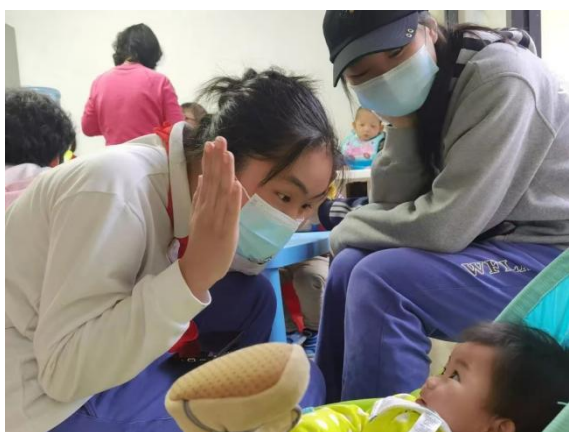
图②社团学生与福利院儿童互动

通过项目驱动，社团的学生们亲身参与到公益服务的每一个具体细节中，一方面，鉴赏、聆听、创作看得见的艺术作品，可以提升学生欣赏美的能力，增强对美的领悟力，进而激发学生对美的创造力。另一方面，寓教于乐、寓教于美的教育手段能够帮助学生提高辨别是非美丑的能力，提升学生的思想道德意识，形成正确的审美观、价值观、职业观。通过社团的公益活动采取多样化的美育手段，充分发挥美育优势，能够有效地带动思想政治教育，在协同共进中形成二者的合力。