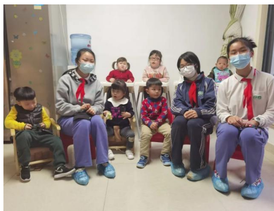
图③社团学生与福利院儿童合影