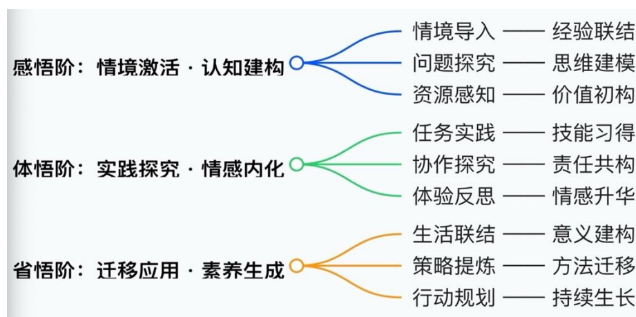
图3 《学做家务活》“三悟”课堂实施

基于反思性实践，在“家务活分享会”中为学生提供自省调整的平台，通过小组分享干家务劳动中遇到的困难与收获，引导学生从自身出发进行内省性认知，将零散的实践体验升华为系统的劳动认知，并以他人故事为镜，在思辨中将“个体实践”迁移到“家庭责任共担”的场景中，让学生主动将对家庭的“责任意识”转化为可操作、可坚持的具体行为，借助“家务劳动打卡表”的设计与课后实施评价，解决家务活“怎么做”、“坚持做”的行动落地问题，实现了从“认知认同”到“行为自觉”的素养培养。