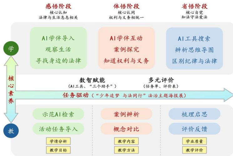
图 4 五年级下《感受生活中的法律》“三悟”课堂实施