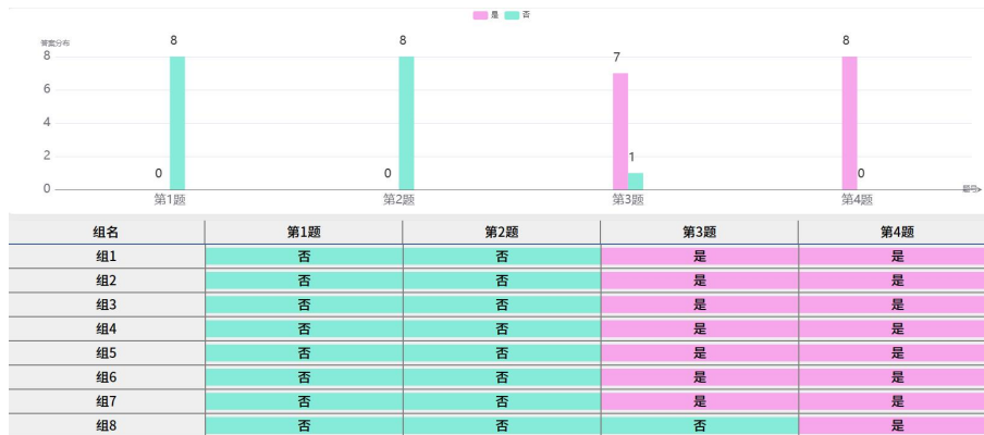
图 2 数字化平台数据汇总实例

数字化课堂使得每个小组的实验结果被准确记录和展示，确保了每个学生都能基于自己小组的实际数据进行分析 and 讨论。这种独立分析的过程减少了从众心理的影响，鼓励学生更客观、自信地面对实验结果，提高学生基于证据表达结论的能力。同时，教师还可以选择具有代表性的结果进行深入分析和评价，进一步激发学生的思考，促进他们的有效学习和深度学习。