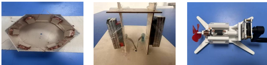
图2 发电机模型改进设计图

经过问题的分类整理与集体讨论，学生逐步从零散的现象性疑惑转向系统性思考，最终聚焦出后续实验探究的核心方向：线圈匝数、磁场强弱、转动速度如何影响感应电流大小？如何通过结构优化提升能量转化效率？针对这些核心问题，学生设计对照实验，规范记录数据，分析实验结论，并将结论应用于模型改进。