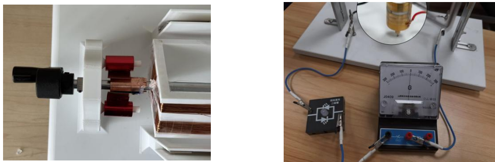
图 3 换向器结构图

因。各小组结合这一发现，开展针对性改进：有的小组调整换向器铜片的角度，增加与电刷的接触面积；有的小组加固导线连接，减少电路连接处的接触不良问题；还有的小组优化转子结构，使线圈转动更平稳。通过反复测试与调整，绝大多数小组的模型实现了 LED 灯稳定发光的目标。